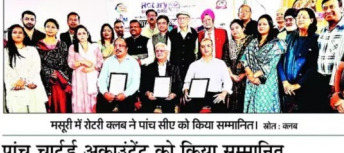
मसूरी में रोटरी क्लब ने पांच सीए को किया सम्मानित।